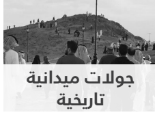
جولات ميدانية تاريخية