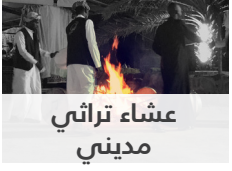
عشاء تراثي مديني

سيتم التركيز على منهجيات وممارسات تطوير السياسات العامة لتكون فعّالة في خدمة المجتمع و المعنيين من ذوي العلاقة. وتغطية جميع مراحل إعداد السياسات العامة وتشتمل على تمارين جماعية للمشاركين من خلال استخدام دراسات حالة عملية من واقع تجربة حكومة دبي والإمارات وبعض الدول المختارة وذلك بهدف تبادل المعرفة والخبرات وتعزيزها لدي جميع المشاركين. وسوف يتمكن المشاركون من القدرة على تطوير وتنفيذ السياسات العامة المستندة إلى أدلة علمية واستخدام التحليل والأدلة البحثية لتطوير السياسات العامة بشكل استراتيجي، وكذلك الابتكار وتطبيق أفضل الأساليب في عملية تطوير وتنفيذ السياسات العامة.