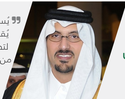
صاحب السمو الملكي الأمير سعود بن خالد الفيصل

” يسعدني أن هناك برنامج تعليمي تنفيذي عالي المستوى يُقدم في المدينة المنورة. لقد وجدت البرنامج المتقدم لتطوير المهارات القيادية والإدارية ذو تجربة غنية وفريدة من نوعها لمست الجوانب الذهنية، والروحانية، والعاطفية، والجسدية من جوانب التنمية القيادية “