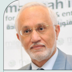
د/ باسل مصطفى بروفيسور القيادة، جامعة أكسفورد