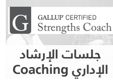
جلسات الإرشاد Coaching الإداري