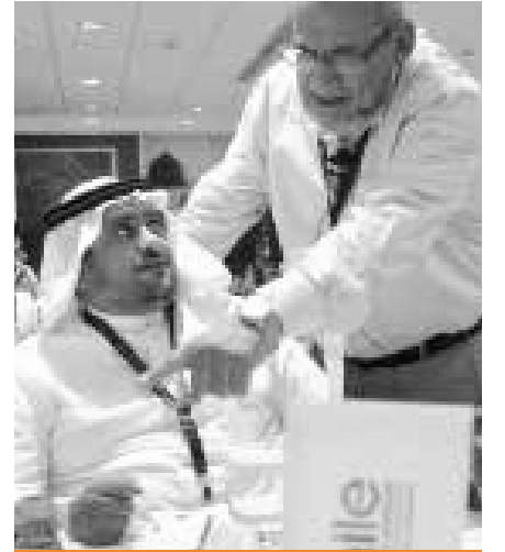
جلسات الإرشاد الإداري Coaching