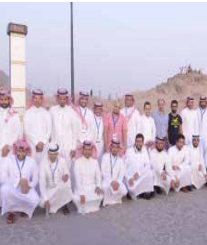
جولات ميدانية تاريخية