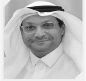
البروفيسور / هاني العمري رئيس قسم إدارة الأعمال جامعة الملك عبدالعزيز