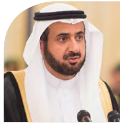
معالي الدكتور توفيق الربيعية

تسعى الدول لتحقيق التنمية المستدامة وضمان عدم تأثرها بالأوضاع المالية للدولة وتعزيز القدرة على تجاوز الأزمات من خلال الاستفادة القصوى من مواردها البشرية والمالية والطبيعية. وتؤكد أهداف التنمية المستدامة على ضرورة عدم المساس بثروات الأجيال القادمة التي تدعم تلبية حاجاته وضمان عدم الإفراط في الاعتماد على الموارد الطبيعية وذلك من خلال تبني أفضل الآليات الكفيلة بتحديد المخاطر المحتملة والتعامل معها على المدى المتوسط والطويل. لذلك أصبح من الضروري على القيادات بالأجهزة الحكومية التعرف بعمق على أهداف التنمية المستدامة وكيفية تحقيق التوازن فيما بينها وتخصيص الموارد المحدودة لتحقيقها. وسيتم استخدام مبادرة تفاعلية لشرح هذه المفاهيم في صورة مبسطة وشيقة.