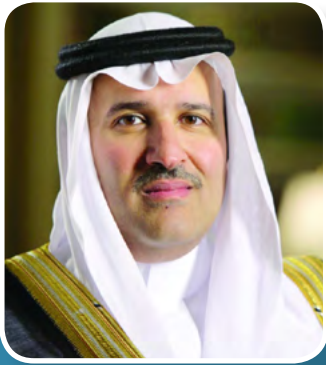
تحت رعاية صاحب السمو الملكي الأمير فيصل بن سلمان بن عبد العزيز آل سعود أمير منطقة المدينة المنورة

لكي تتمكن المملكة من تحقيق رؤيتها، كان من الواجب التركيز على العنصر البشري الذي يعتبر المحرك الأساسي لتحقيق تطورات المملكة. ويعتبر تطوير كادر من القيادات الواعدة لإدارة دفة عملية التحول ومتابعة تنفيذ توجهات الرؤية وهندسة وإدارة التغيير من أهم مقومات نجاح تحقيق الرؤية.