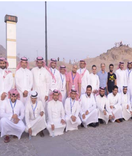
جولات ميدانية تاريخية