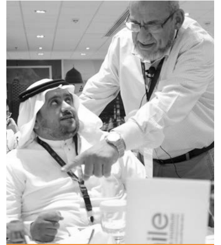
جلسات الإرشاد الإداري Coaching