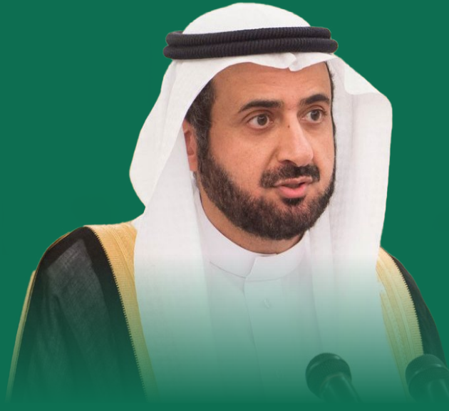
معالي الدكتور توفيق الربيعة وزير الصحة المملكة العربية السعودية

” لقد سعدت بالمشاركة في أحد برامج المعهد والذي استفدت منه كثيراً، وما يميز برامج المعهد هو الجودة العالية للمحاضرين الدوليين وما يتمتعون به من خبرة ومعرفة متعمقة، وكذلك المزيج المتميز من المشاركين من القيادات التنفيذية من عدة دول وما يتمتعون به من خبرات عملية متنوعة. ويتميز البرنامج بخلق جو تفاعلي بين المشاركين يمكن من تبادل المعرفة، كما يتميز بتنوع الأدوات التدريبية المستخدمة مثل دراسة الحالات وحلقات النقاش. كما يعتبر مكان عقد البرنامج في حد ذاته من أهم عناصر نجاحه.“