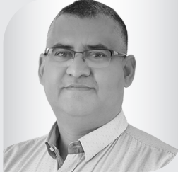
د/ إدريس اوهلال مستشار دولي في مجال الاستراتيجية