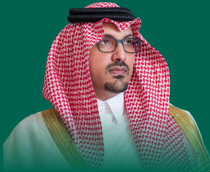
صاحب السمو الملكي الأمير سعود بن خالد الفيصل آل سعود نائب أمير منطقة المدينة المنورة

يُسعدني أن هناك برنامج تعليمي تنفيذي عالي المستوى يُقدم في المدينة المنورة. لقد وجدت البرنامج المتقدم لتطوير المهارات القيادية والإدارية ذو تجربة غنية وفريدة من نوعها لمست الجوانب الذهنية، والروحانية، والعاطفية، والجسدية من جوانب التنمية القيادية.