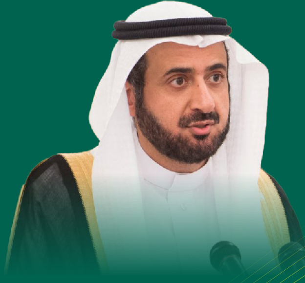
معالي الدكتور توفيق الربيعة وزير الحج والعمرة المملكة العربية السعودية

لقد سعدت بالمشاركة في أحد برامج المعهد والذي استفدت منه كثيراً، وما يميز برامج المعهد هو الجودة العالية للمحاضرين الدوليين وما يتمتعون به من خبرة ومعرفة متعمقة، وكذلك المزيح المتميز من المشاركين من القيادات التنفيذية من عدة دول وما يتمتعون به من خبرات عملية متنوعة. ويتميز البرنامج بخلق جو تفاعلي بين المشاركين يمكن من تبادل المعرفة، كما يتميز بتنوع الأدوات التدريبية المستخدمة مثل دراسة الحالات وحلقات النقاش. كما يعتبر مكان عقد البرنامج في حد ذاته من أهم عناصر نجاحه.