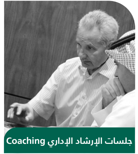
جلسات الإرشاد الإداري Coaching