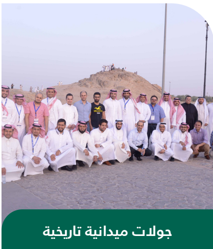
جولات ميدانية تاريخية