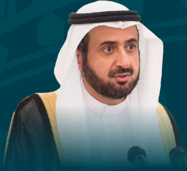
معالي الدكتور توفيق الربيعة وزير الحج والعمرة المملكة العربية السعودية

لقد سعدت بالمشاركة في أحد برامج المعهد والذي استفدت منه كثيراً، وما يميز برامج المعهد هو الجودة العالية للمحاضرين الدوليين وما يتمتعون به من خبرة ومعرفة متعمقة، وكذلك المزيح المتميز من المشاركين من القيادات التنفيذية من عدة دول وما يتمتعون به من خبرات عملية متنوعة. ويتميز البرنامج بخلق جو تفاعلي بين المشاركين يمكن من تبادل المعرفة، كما يتميز بتنوع الأدوات التدريبية المستخدمة مثل دراسة الحالات وحلقات النقاش. كما يعتبر مكان عقد البرنامج في حد ذاته من أهم عناصر نجاحه.